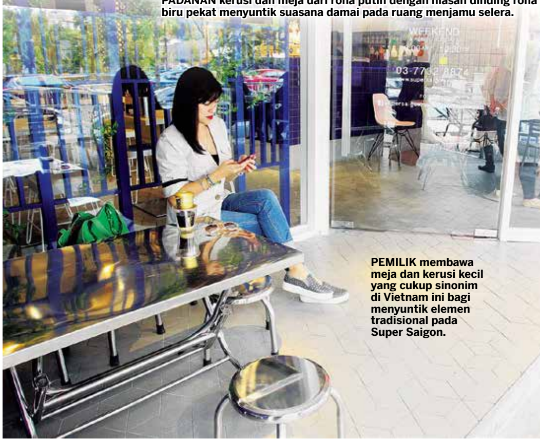
PEMILIK membawa meja dan kerusi kecil yang cukup sinonim di Vietnam ini bagi menyuntik elemen tradisional pada Super Saigon.

K AWASAN di Taman Tun Dr. Ismail, Kuala Lumpur tengah hari itu cukup sesak dengan kereta memandangkan jam menunjukkan waktu makan tengah hari.