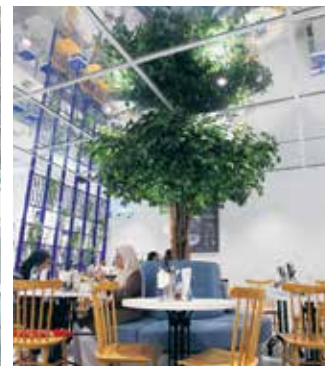
PEMILIHAN siling kaca menjadikan kawasan restoran nampak mewah dan unik.