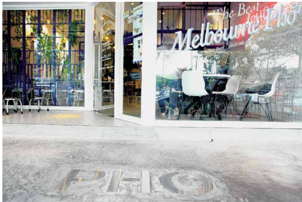
BAHAGIAN hadapan premis ini turut disertakan perkataan Pho pada lantai bagi menunjukkan jenis menu yang disajikan.