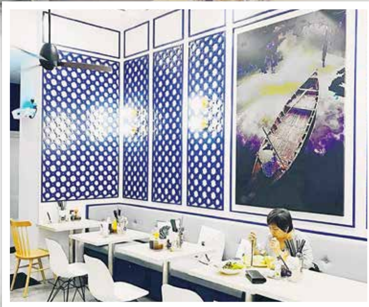
PADANAN kerusi dan meja dari rona putih dengan hiasan dinding rona biru pekat menyuntik suasana damai pada ruang menjamu selera.