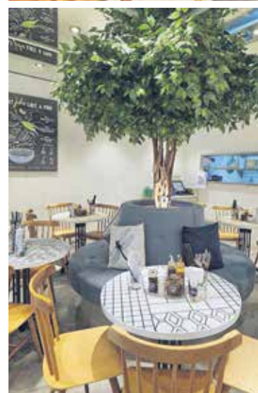
PEMILIK cukup bijak menyuntik elemen segar dan semula jadi pada ruang restoran dengan meletakkan pokok besar di ruang makan.