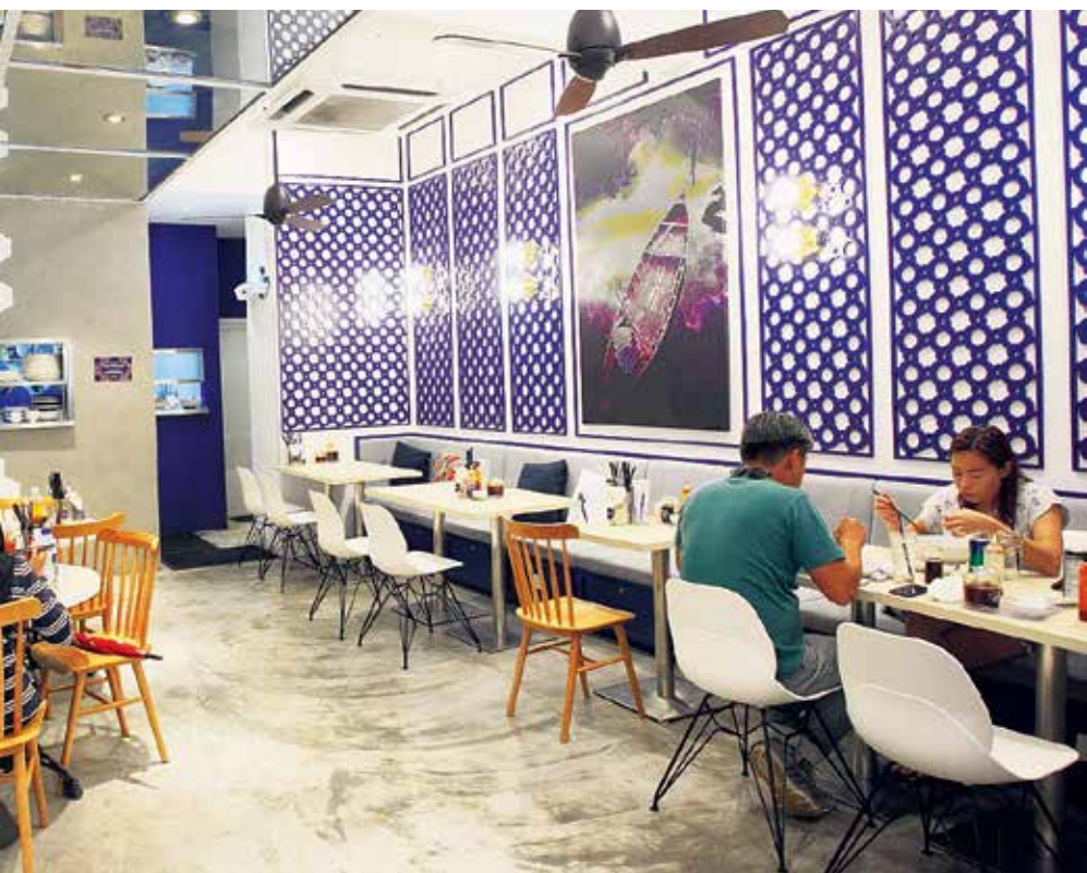
UKIRAN dinding daripada rona biru pada sudut ini menyerlahkan dekorasi Super Saigon, seterusnya menjadikan suasana nampak harmoni.

...ak di Taman Tun Dr. Ismail itu menggabungkan dua warna iaitu biru dan ...n dalamannya dan hasilnya cukup memukau dan menenangkan.