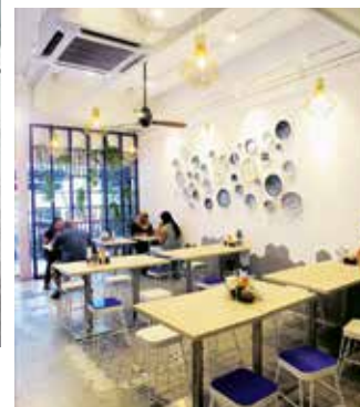
DINDING dari rona putih menjadikan Super Saigon kelihatan luas.

...ak di Taman Tun Dr. Ismail itu menggabungkan dua warna iaitu biru dan ...n dalamannya dan hasilnya cukup memukau dan menenangkan.